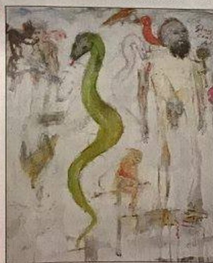
Links: Brüder, oder doch nur einer? Angst und Verzweiflung scheinen auf dem Bild in der Mitte dargestellt. Im Zentrum des Bildes rechts: die Schlange.